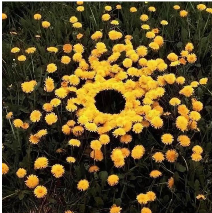
A flower installation (dandelion)