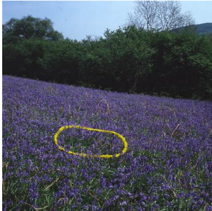
Dandelion circle on bluebells , Brough, Cumbria, 1985 (Cercle de pissenlits au milieu des jacinthes des bois).

Andy Goldsworthy, né le 26 juillet 1956, dans le Cheshire, en Angleterre est un sculpteur, land artist, et photographe anglais, connu pour ses œuvres éphémères, créées à l'air libre avec des matériaux naturels qu'il trouve sur place. ****