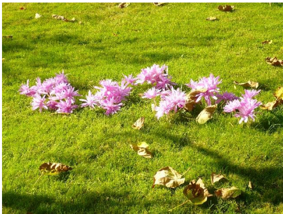
Crocus à Giverny chez Claude Monet

Sentir passer, à travers la porte ferrée, Sirocco et Borée, et tous les Vents en guerre. Ainsi est l'hiver, mais, tel qu'il est, il apporte ses joies.