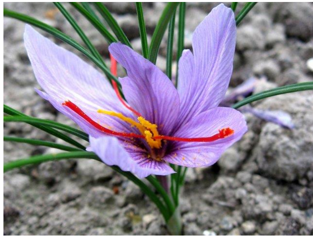
Crocus à safran